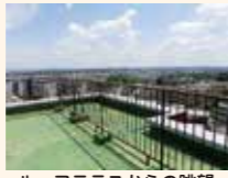
ルーフトラスからの眺望

東山台スカイマンション 名古屋市名東区植園町一丁目10番地 7階5LDKトランクルーム付・専用ルーフトラス付