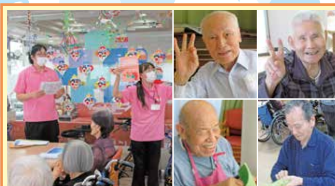
南山 母の日はかわいらしくカーネーションの手作りカードをお渡しして父の日は、色画用紙にシールを貼ってペットボトルホルダーを作りました。南山のお母様、お父様はとてもリラックスされた表情でいつになく会話が弾んでみえました。