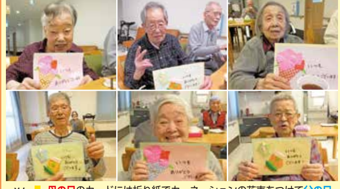
鷺沼 母の日のカードには折り紙でカーネーションの花束をつけて父の日には、ワイシャツとネクタイ そしてお父さんが好きな枝豆とビールをカードの中に入れました。そのカードを見ながら穏やかな時間の中でそれぞれ想いを馳せながらコーヒーを召し上がっていらっしゃいました。