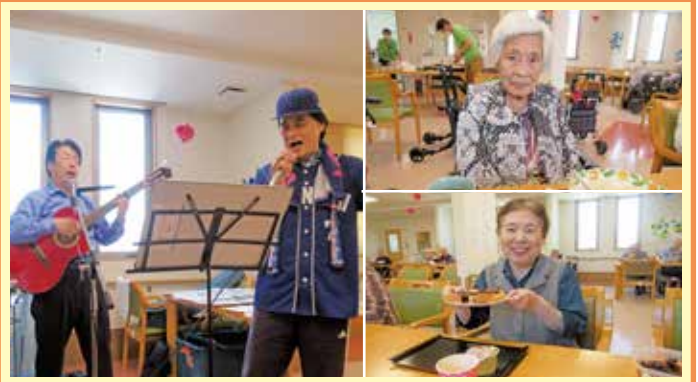
岩倉 母の日には、フレンチトーストと手作りカードをプレゼント、父の日には手作りクレープを美味しく召し上がって頂きました。歌謡コンサートでご家族様が「燃えよドラゴンズ」を熱唱してくださいましたがとてもパワーが漲ってかっこよかったです。