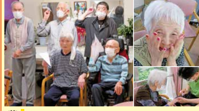
藤が丘 父の日は紙飛行機距離競争をしました。お父さんたちは童心にかえて楽しんで下さりプレゼントは水筒とお菓子です。母の日はお母さんにちょっとおしゃれをして頂きたいという思いでネイルをさせて頂きました。プレゼントもとても喜んで下さいました。