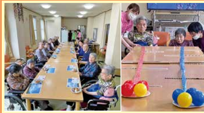
各務原 母の日は赤チーム、青チームに分かれボール運びゲームをしてからそばめしを、父の日は筒通しゲームをしてからお好み焼きをつくりました。