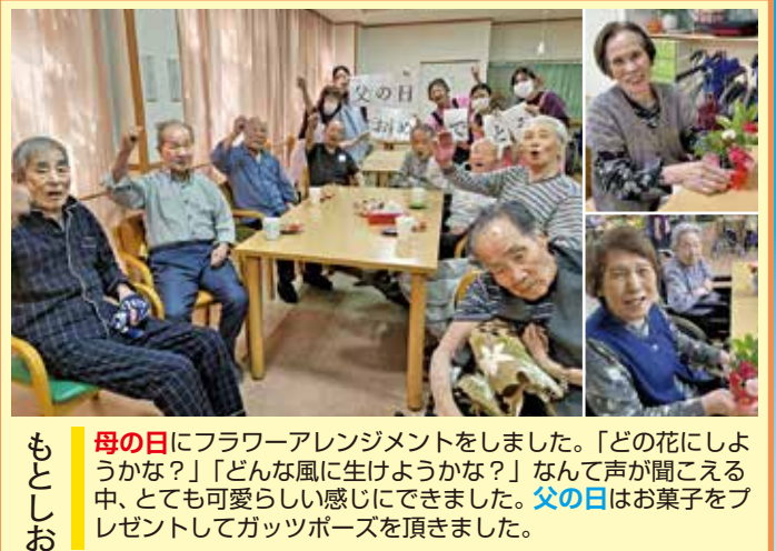
もてしお 母の日にフラワーアレンジメントをしました。「どの花にしようかな?」「どんな風に生けようかな?」なんて声が聞こえる中、とても可愛い感じにできました。父の日はお菓子をプレゼントしてガッツポーズを頂きました。