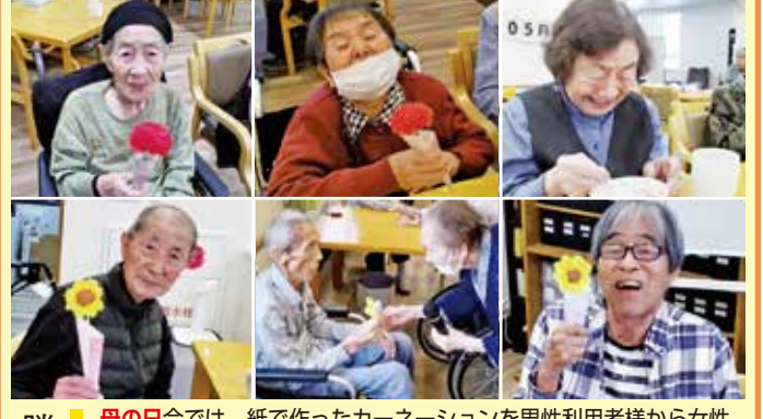
勝川 母の日会では、紙で作ったカーネーションを男性利用者様から女性利用者様へ日頃の感謝の言葉とともにお渡ししてコーヒーゼリー・フルーツ・クリームを飾って食べていただきました。父の日では、紙で作ったひまわりを女性利用者から男性利用者へ渡して、餃子皮でピザを焼いて召し上がって頂きました。