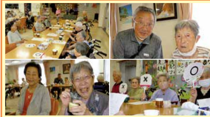
鳴海 母の日はスタッフ手作りの洋菓子とハーブティー、父の日は抹茶プリンとコーヒーを飲みながらゲームをしました。ご家族様も参加して下さい微笑ましかったです。楽しい会話に笑顔の花が咲きました。