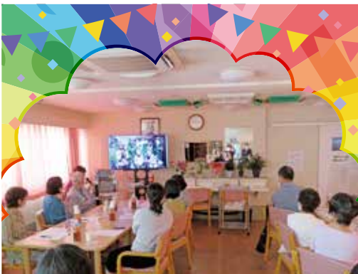
ゆうゆう未来館 藤が丘 6月16日 AM