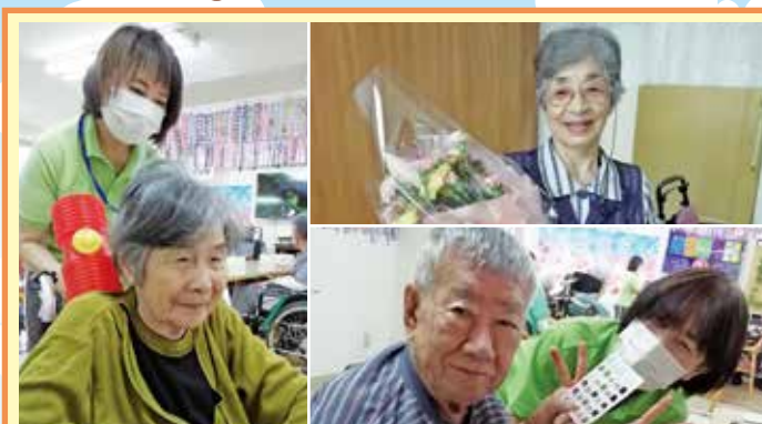
春日井 母さんお肩をたたきましょう♪ 何ぞ叩きましょうか? 母の日は肩たたきとビンゴゲームそしてプリンアラモードを召し上がって頂き、父の日はとん平焼きをお腹いっぱい召し上がって頂きました。