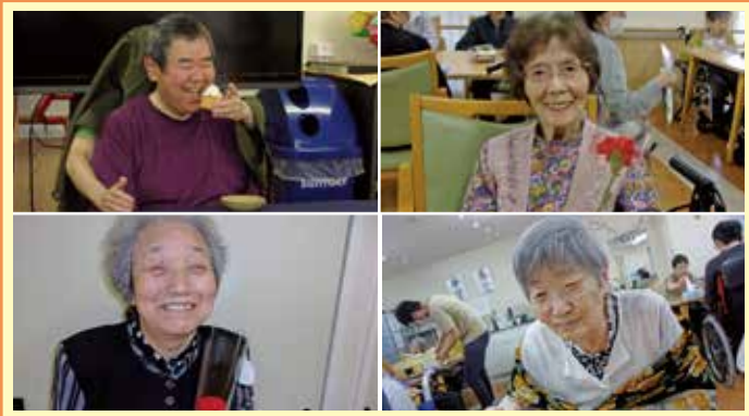
稲沢 母の日は母の日にちなんだ歌を歌ってカーネーションをプレゼント、父の日はスタッフによる二人羽織をしました。お茶・お蕎麦シュークリームと食べさせてもらいましたが、利用者様はハラハラドキドキしながら笑い声と共に楽しんで頂きました。