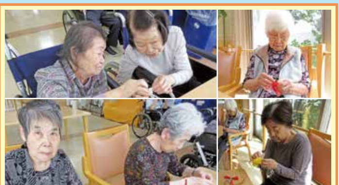
小牧 小牧のご利用者様は手先が器用で工作は得意な方が多いです。父の日、母の日も折り紙でサクサクお花を作りました。利用者様同士がお互いに教えてたり教えられたりしている姿はとても優しい気持ちが伝わって嬉しくなります。