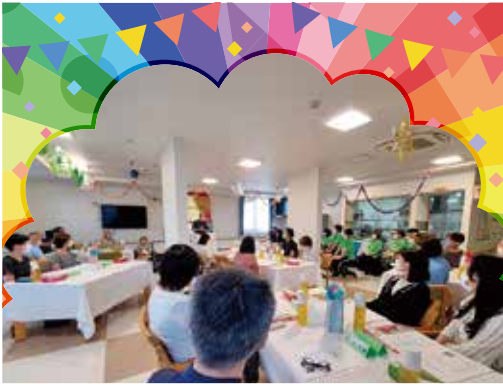
ゆうゆう未来館 鶴沼 6月15日 AM