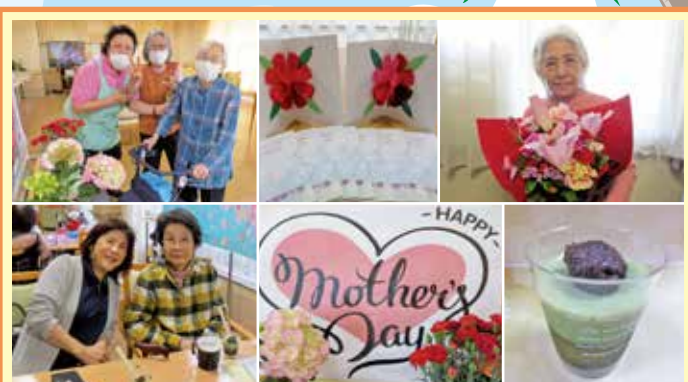
柳ヶ瀬 母の日は彦坂スタッフの手作りデザート「抹茶プリン」を皆さんに召し上がって頂きました。父の日はカラオケをして熱唱していただきました