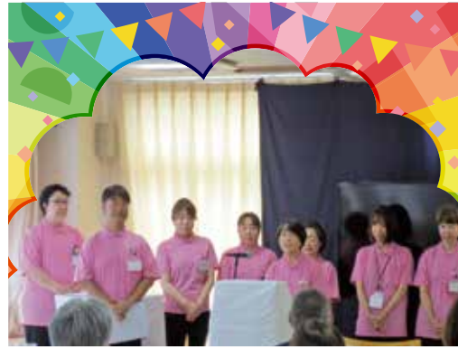
ゆうゆう未来館 柳ヶ瀬 6月15日 PM