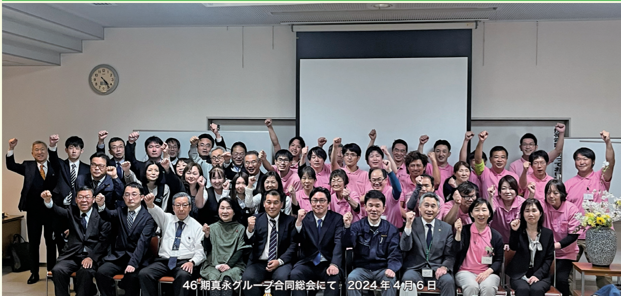
46期真永グループ合同総会にて 2024年4月6日