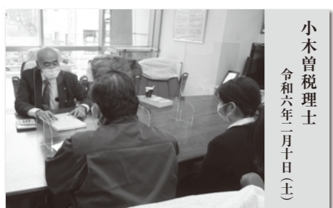
小木曾税理士 令和六年二月十日(土)

今回初めて不動産の売買をしたので、確定申告をやることになり個別税務相談をうけました。確定申告をいうものは、仕事上で住宅の家賃減額申請を少しだけ触れる機会がありました。自身で記入するのは初めてでした。当初は長期の居住控除があり、税金がかからず簡単に考えていましたが先生の話を聞いて、現在の状況から母と私自身の2名分の申請をするには初めての方には少々手間がかかることアドバイスを頂き先生にお任せすることになりました。相談会では先生も私自身の問題に親身になって相談に乗って頂いて、とてもわかりやすく説明頂き、今後お任せすることに安心しております。これからは連絡を密にとり対応していきたく思っています。ありがとうございます。