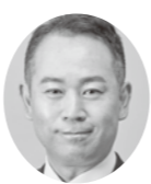
名古屋市長 谷本 雄一