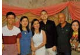
フィリピンの家族