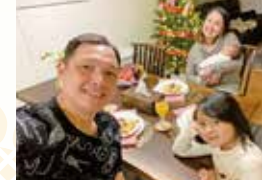
長男が生まれた時

私はフィリピンで生まれ、24歳までフィリピンで生活していました。交際期間10年の夫とフィリピンで結婚し、今は長女(小学校2年生)、長男(1歳)の4人家族です。フィリピンに住んでいた時は、小学校1、2年生の英語の先生をしていました。日本に来たきっかけは、夫が交際5年程で、日本に住んでいる家族の看病のため帰国したので、5年間は夫に会いに日本とフィリピンを行き来するなど、離れて交際していましたが、結婚を機に日本で生活することになりました。