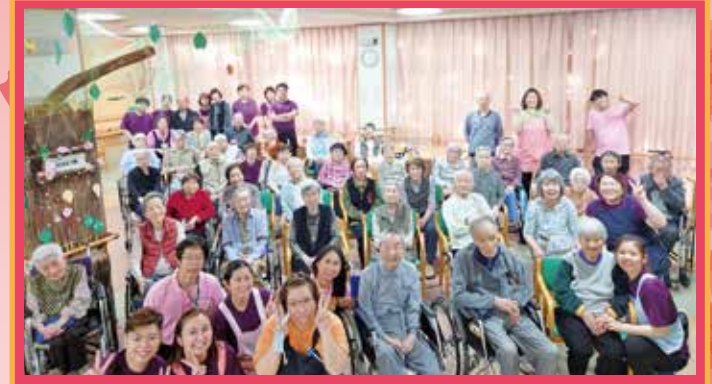
母の日は、チョコソースとイチゴソースを付けてマシュマロを召し上がって頂き、その後、カーネーションをご利用者のアレンジで生けてお部屋に飾って頂きました「ハイ！全員集合～」と言ったら皆さん集まって下さるところはもとしいところですよ(^^)！せっかくなのでマスクを外して撮影しましたがとてもいい記念写真になりました。