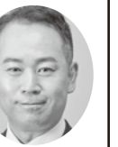
名古屋市長議員 たなべ 雄一