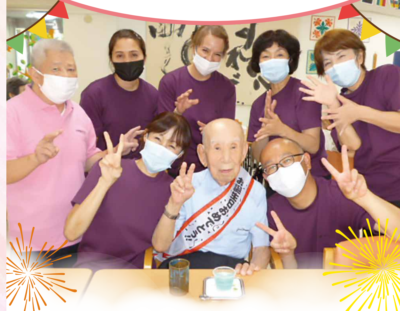
J様(要介護2) 95歳 お誕生日記念日お祝い