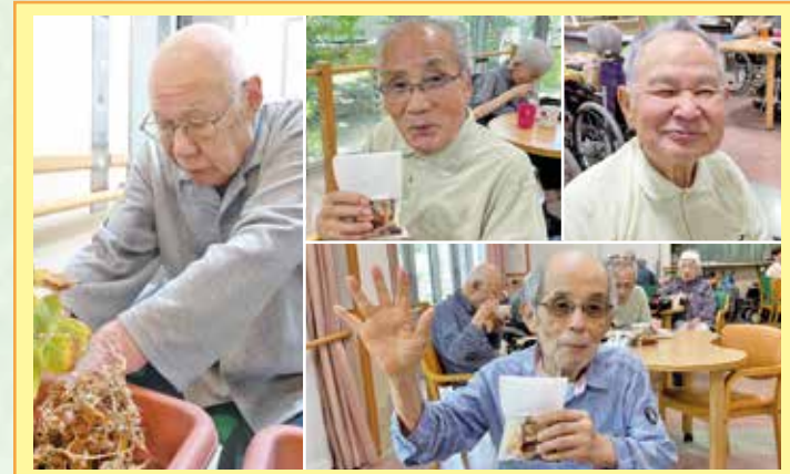
もとしお 普段、お菓子は食べないので、お菓子のプレゼントは大変喜ばれました。この時期、芋ほり体験をして頂くとうらなうーに移したジャガイモをご利用者様に体験して頂きました。これが意外とウケて皆さん一生懸命探して下さいました。