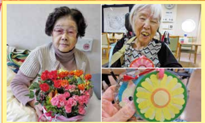
柳ヶ瀬 仕事が得意なスタッフ中心にガーベラの花のネームプレートをプレゼントしました。花言葉は「希望・常に前進・前向き」です。たくさんのお花やプレゼントが届き、笑顔であふれる「母の日」となりました。