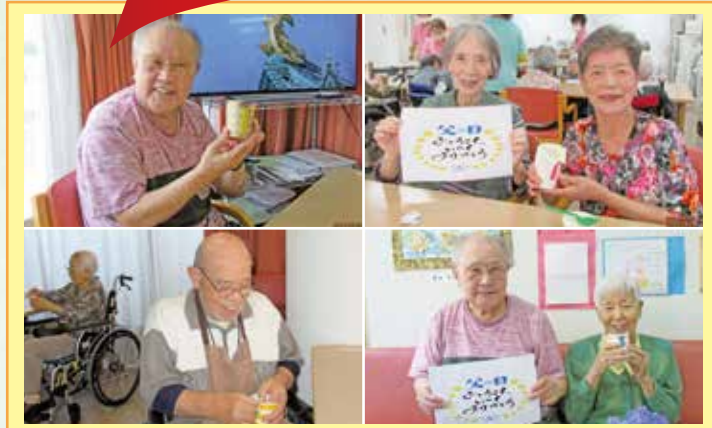
南山 紙コップにネクタイを付けて、小物入れを作成して頂きました。個性あふれる小物入れが出来上がりました。作成後に、アイスクリームを召し上がって頂きました以前はアルコールをたしなんでいらしたお父様方、今やスイーツに。時の流れを感じてみました。