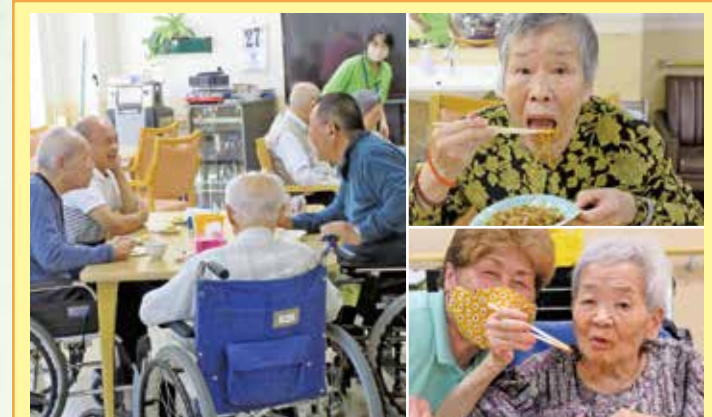
小牧 「スタッフが作ると、同じ焼きそばでも一味も二味も違うようです。くつろぎの時間を楽しみました。」普段、食の細いご利用者様が太盛を召し上がり、私たちスタッフはびっくりしました。