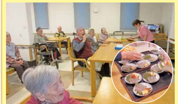
鷲沼 5/5は子供の日だけど、端午の節句ってどういう意味?子供のおこころを思い出しながら「せいくらべ」の抜けた歌詞を穴埋めして頂きました。合唱が終わった後はスタッフ手作りのおやつ。柏の葉っぱの上に桜の花入りゼリーとフルーツを添えて。スタッフも一緒に美味しく頂きました!