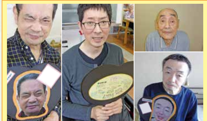
稲沢 6/19は父の日でした。去年のうちは実用的で無いから使えんとうのご指摘ありまして、今年はペンジで実用的なうちわを作りました。職員の手書きを裏に貼りました。お茶会に合わせてうちわを持って写真を撮りました。女性から来年の母の日はカーネーションで無くうちわが良いと言われました。