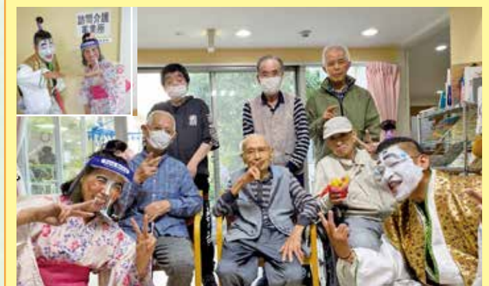
藤が丘 今年は父の日に平林所長のバカ殿様と腰元女優、水野に大爆笑!!バカ殿様が、人生楽ありや苦のあるさあ〜の曲『あ人生に涙あり』を歌い、盛り上がったところで、水のいらない観葉植物をプレゼントさせて頂き美味しいコーヒータイムとなりました。