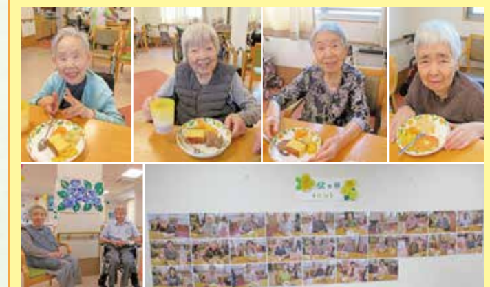
岩倉 今母の日は、カステラにフルーツとアイスクリーム。父の日は、マドレーヌにフルーツとアイスクリームを添えて皆様へ召し上げて頂きました。特にアイスクリームはおかわりができる程好評でした。ご夫婦で入居されている利用者様の奥様は「こんな事してもらえてありがたいです。」と感動して下さいました。