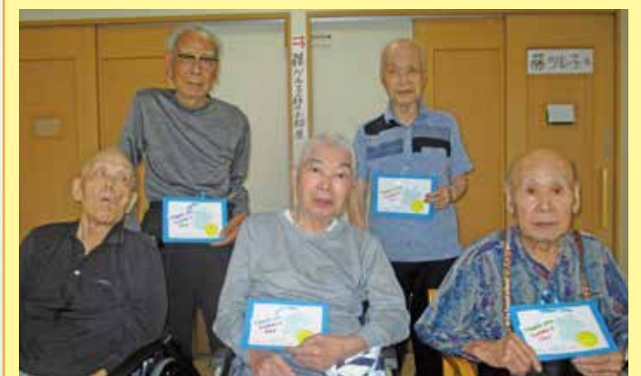
三好 7名いるはずのお父さん、今は2名が入院されており、5名で写真を撮りました。当日はドリッパでコーヒーをお入れし、日頃の感謝を伝えました。