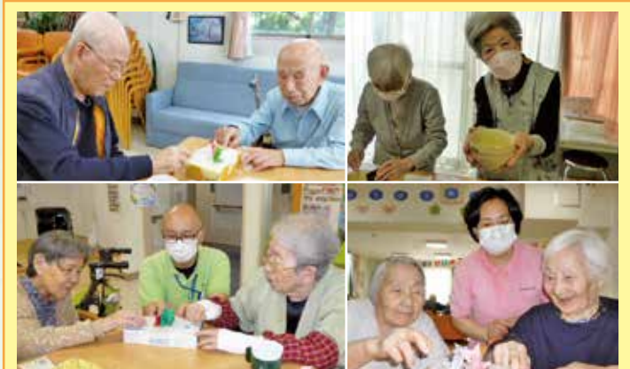
鳴海 母の日は、ご利用者様がお茶を点て下さったのですが昔取った袴柄で、とっても美味しいお抹茶を頂きました。父の日は紙相撲トーナメントを行いました。箱を叩く打つ簡単なゲームですが皆さん真剣になり、優勝戦は周りの大応援があり熱戦でした。