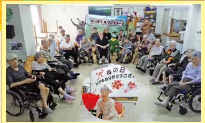
春日井 母の日には手作りの大きなカーネーションをプレゼントしました。父の日は、ゆうゆうサファリで動物?に触れて頂き、盛り上がりました。沢山の動物をご覧になりたい方は、HPのブログを見て下さいね(^^)