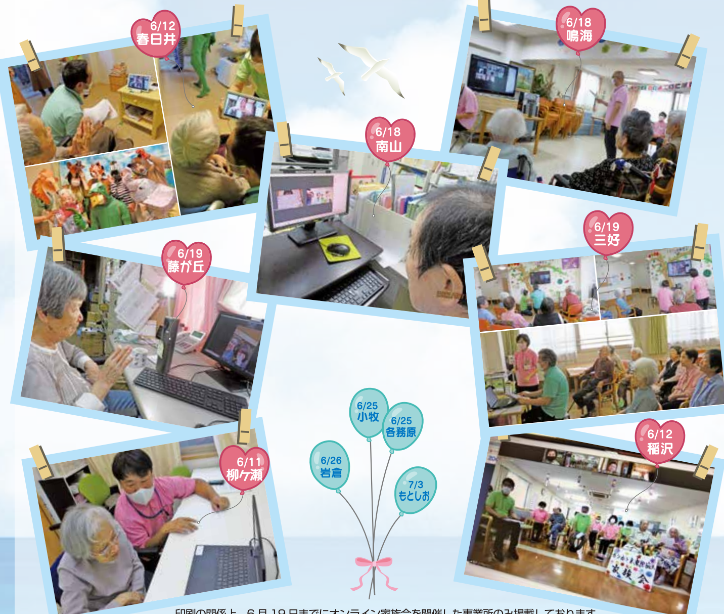
印刷の関係上、6月19日までにオンライン家族会を開催した事業所の掲載しております

令和2年から、コロナウイルス感染防止を踏まえた家族会となりました。アンケートに基づいてお話をさせて頂きました。ご利用者様、ご家族様には大変なご理解とご協力を賜り、厚く御礼申し上げます。オンライン家族会のあとは、オンラインによる面会をして頂きました。従来ですとご家族様にお越し頂きまして、楽しいひとときを過ごして頂いております。早くそんな日が来ることを願っています。