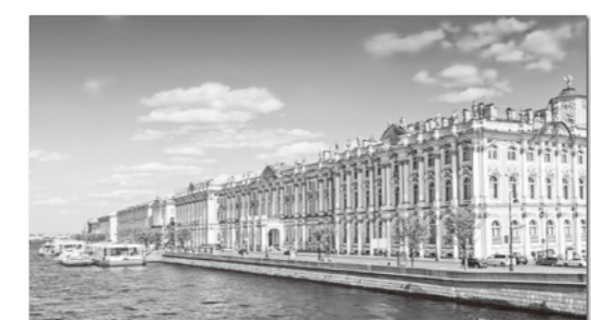
ロシアのエルミタージュ美術館

「ロシアが誇るべきもの」 ロシアがウクライナへ侵攻して、一ヶ月以上が経ちました。私の中のロシアと言えば、以前鑑賞した展覧会を思い出します。 「ロシアのモナリザ」と称される作品をはじめ、肖像画や人物画など多くの作品が、展示されました。中でも、印象的なのはロシアの四季を描いた風景画です。ロシアでは長く厳しい冬があることで、春・夏・秋をとっても大切にそれを謳歌している様子が、鮮やかな色彩で描かれています。普段であれば展覧会を鑑賞した際には、図録を購入しようか迷うのですがこの時は迷うことなく購入しました。