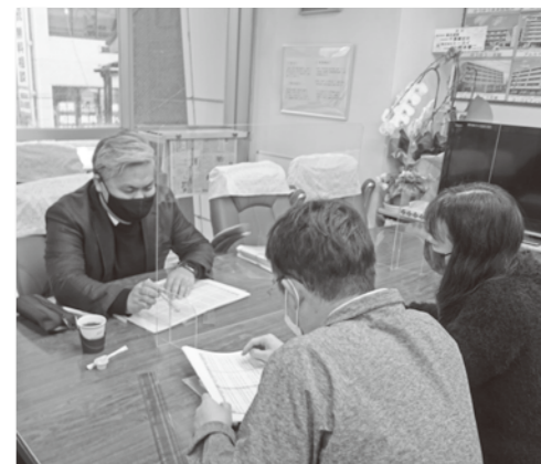
松永税理士 令和4年2月19日(土)

二日間、オーナー家主様、お取引先の皆様が相続・贈与等の申告節税対策の相談にお越し下さいました。