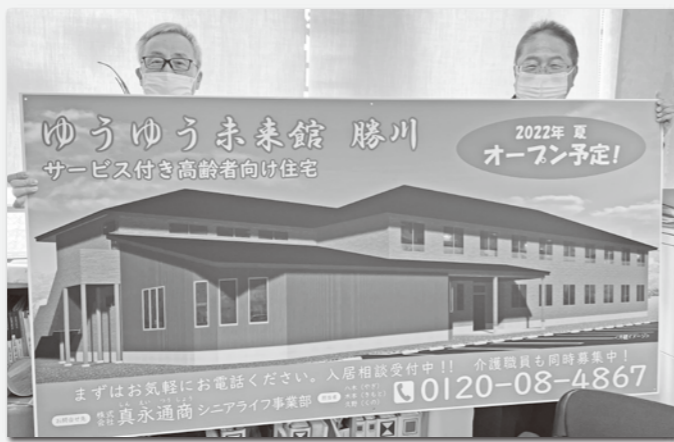
木造 2×4 工法(準耐火構造) 2階建 30戸 愛知県春日井市八幡町

真永グループの核である高齢者事業ゆうゆう未来館の十三番目の施設であるゆうゆう未来館勝川を二月七日に着工しました。建築場所は春日井市八幡町で、木造二階建三十居室の介護サービス併設施設となります。食堂を大空間の間取りにして入居者に満足して頂けるよう設計しました。七月三十一日に工事完成の予定です。オーナー様はもとより、入居者様、介護スタッフ皆さんの喜ぶ顔を夢見ながら安全第一で工事を進めてまいります。