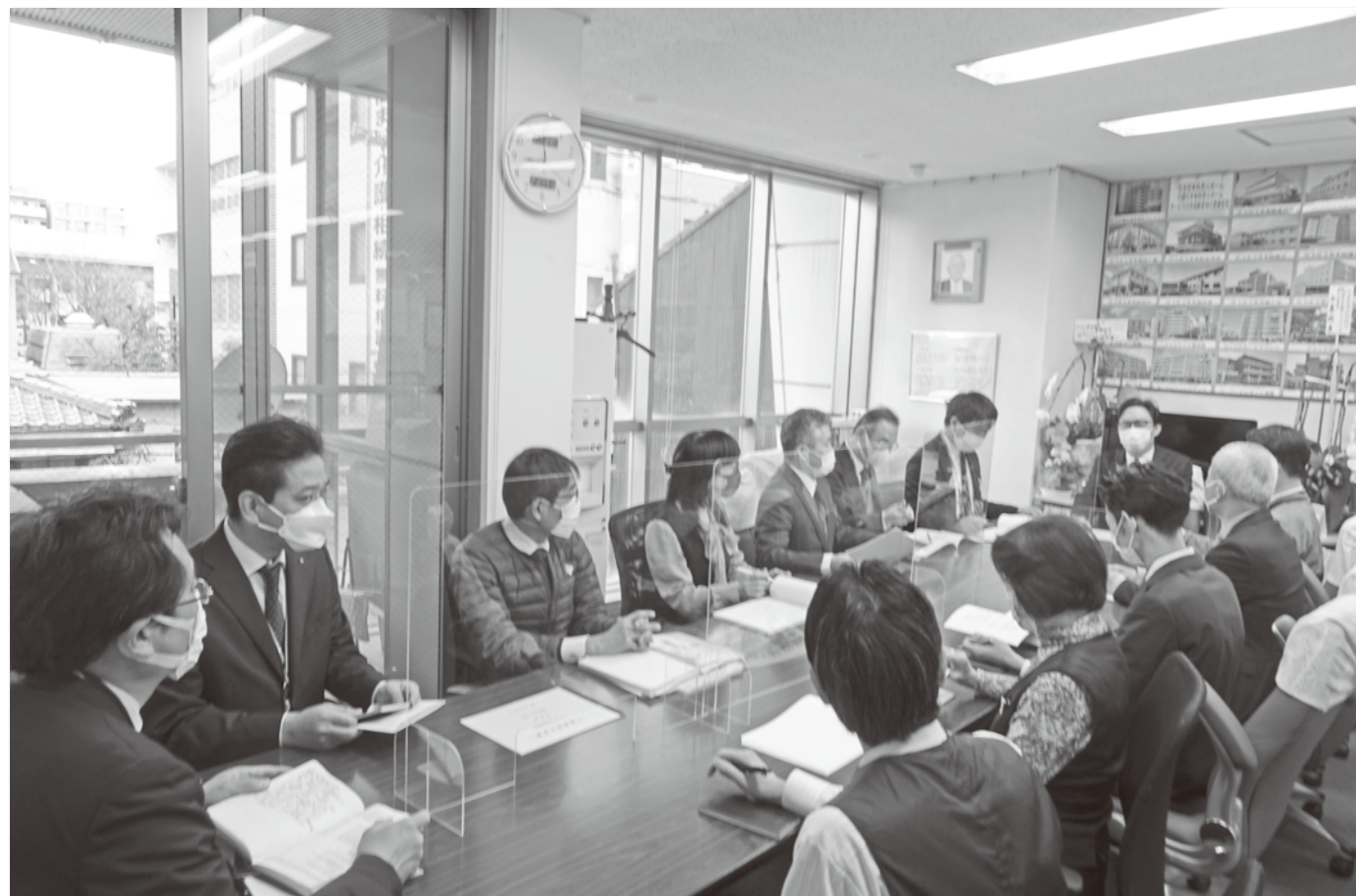
今回の策定会議は時間を短縮して開催、その後資料を部長に提出して最終確認は社長と個別面談というスタイルで行われました。