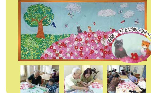
お孫さん手紙もたくさん見せて頂きました