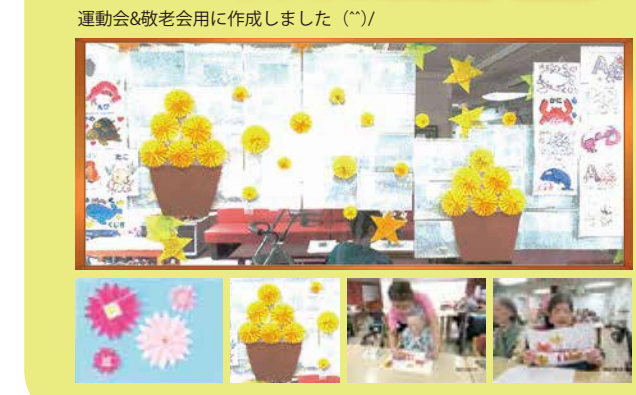
運動会&敬老会用に作成しました (*')/