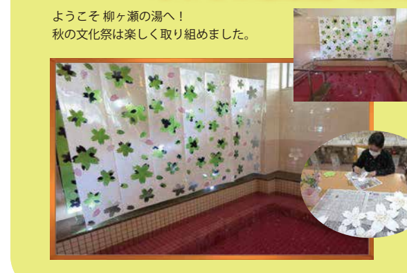
ようこそ 柳ヶ瀬の湯へ! 秋の文化祭は楽しく取り組みました。