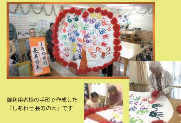
ご利用者様の手形で作成した『しあわせ長寿の木』です