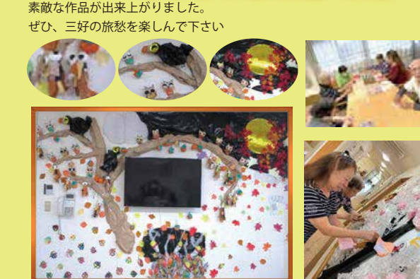
素敵な作品が出来上がりました。ぜひ、三好の旅愁を楽しんで下さい

それぞれの施設で、「秋」を題材に全員で協力し合い様々な作品が完成しました。切り絵があったり、絵葉書があったり、立体物やスプレーアートまで色とりどりの仕上がりに大満足です。