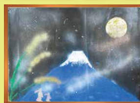
こちらの絵はスプレーアート