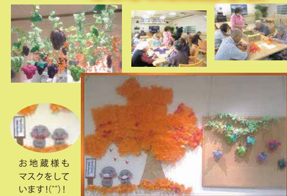
お地蔵様もマスクをしています!(*')