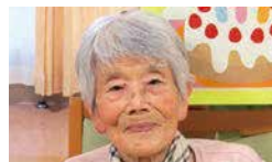
ゆうゆう未来館柳ヶ瀬 YK様 要介護度2→要介護度1

ご本人様 動作が鈍くなる中で、無理をせずにゆっくりとやっています。自分でやれることは「自分でやっていく」ということを大切に思っていますが、色々あるので忙しいスタッフの皆様を支えてもらいなんとかやっています。 Mケアマネ ゆうゆう未来館へご入居され、1年が過ぎようとしています。その間入退院もありました。しかし日々ご自分ができる事は何事も成し遂げようとする姿勢は素晴らしいと感じております。また、日記をつけ、ひ孫さんと会えることを楽しみにされています。コロナ禍が収まり安心して外出の機会を持ち、リフレッシュされるようご支援致します。