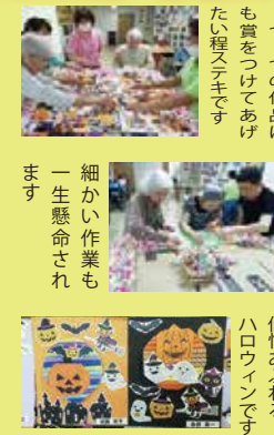
1つ1つの作品にも愛をこめてあげたい程です。細かい作業も一生懸命です。個性あふれるハロウィンです