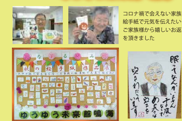
コロナ禍で会えない家族に絵手紙で元気を伝えたい...ご家族様から嬉しいお返事を頂きました