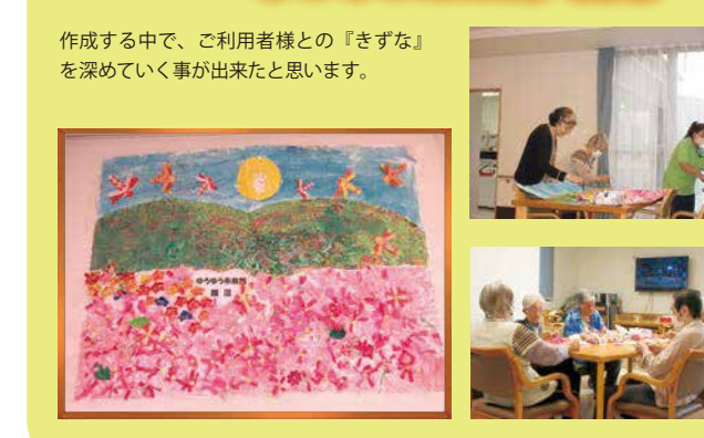
作成する中で、ご利用者様との『きずな』を深めていく事が出来たと思います。