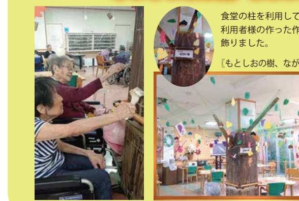
食堂の柱を利用して、ご利用者様の作った作品を飾りました。【もとしおの樹、ながい木】