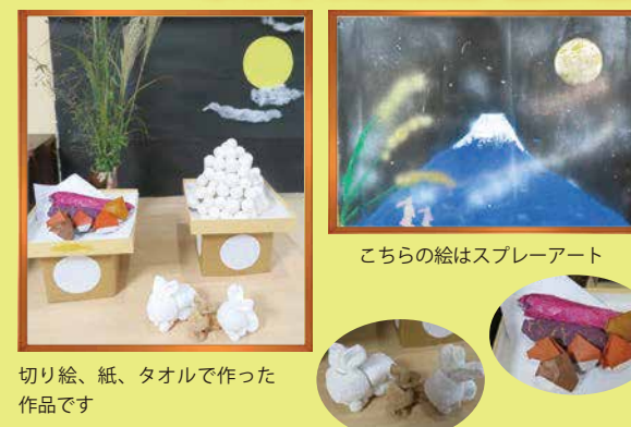
切り絵、紙、タオルで作った作品です