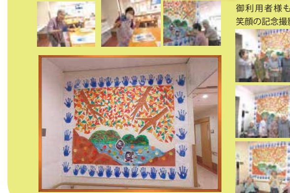
御利用者様も笑顔の記念撮影❤