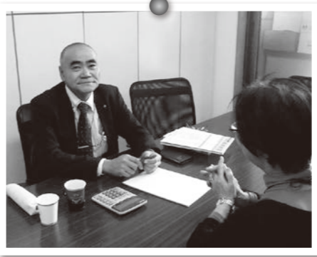
小木曾税理士 令和3年2月13日(土)