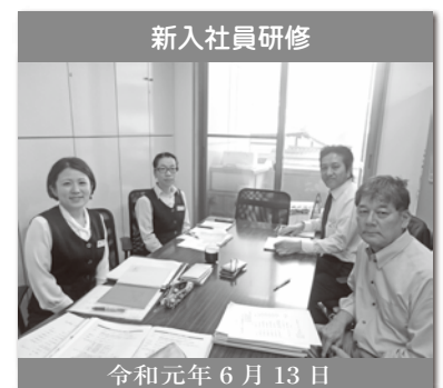
新入社員研修 令和元年 6月13日

資格 建築CAD2級、FP3級 特技 バトミントン 趣味 釣り 宅地建物取引士の資格取得に向けて日々、勉強中です。