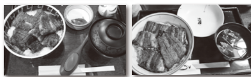
関市「辻屋」 関市「みよし亭」