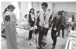
健康コーナーでは、高齢者疑似体験を来春入社予定の高校生が体験

当社は、介護事業も行っているため、理解はしているけれども、出来ていないことなどの振り返りができ、お客様も認知症の言葉は、知っているが実際に目の前の大切な人がそうだった時のことを想定しながら講演を拝聴できたと思います。すべての人にとっても参考になる話が出てとても勉強になりました。大変に感謝しています。これからも、宜しくお願致します。