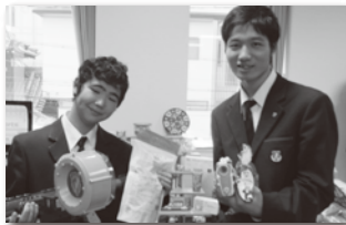
キッズコーナーではゲームを楽しみ景品をゲット!