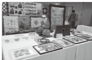
ゆうゆう倶楽部・高齢者住宅にお住まいのご利用者様の作品展示