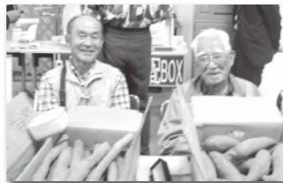
ご支援頂いてますご家族様の採り立てのお野菜をお届け頂き昨年同様一日お付き合ひ頂きました