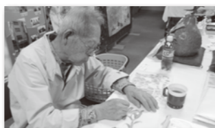
ゆうゆう倶楽部鳴海のご利用者様が実演して下さいました