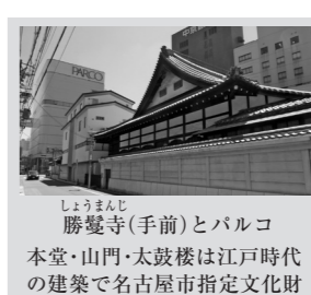
勝鬨寺(手前)とパルコ 本堂・山門・太鼓楼は江戸時代の建築で名古屋市指定文化財

四月から賃貸斡旋課で働いております。以前の職場は久屋大通でしたが、矢場町で働くようになって驚いたのは、「同じ」栄でも南北で全然風景が違う」ということでした。具体的には、久屋大通は巨大な街区にオフィスビルが林立している印象ですが、真永通商の付近は街区も整形ではなく、路地もあり、お寺や古い町