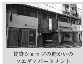
賃貸ショップの向かいのソエダアパートメント

四月から賃貸斡旋課で働いております。以前の職場は久屋大通でしたが、矢場町で働くようになって驚いたのは、「同じ」栄でも南北で全然風景が違う」ということでした。具体的には、久屋大通は巨大な街区にオフィスビルが林立している印象ですが、真永通商の付近は街区も整形ではなく、路地もあり、お寺や古い町