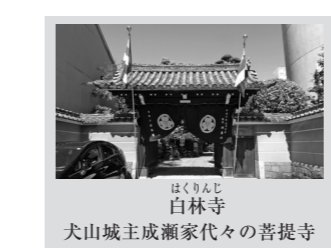
白林寺 犬山城主成瀬家代々の菩提寺

広幅員の若宮大通が開通したせいで、大須と矢場町は別の地域のような感覚を持てていましたが、真永通商付近は、もともと大須の一部だったので、すねどりで、風景が「栄」よりも「大須」に近い訳です。もちろん建物は江戸時代のままではありませんが、寺院や街道が往時の雰囲気を伝えて