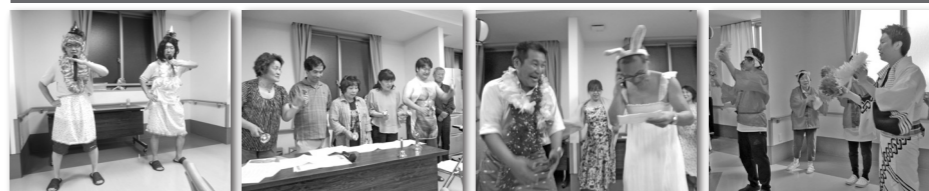
【敢闘賞】 ゆうゆう倶楽部もとお ピンクレディー 【特別賞】 ゆうゆう倶楽部各務原 ハンドベル 【社長賞】 高齢者住宅課+経営管理課 追いかけて寸劇 【代表賞】 ゆうゆう倶楽部岩倉 岩倉音頭盆踊り