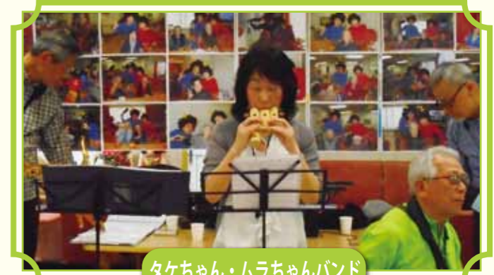
タケちゃん・ムラちゃんバンド