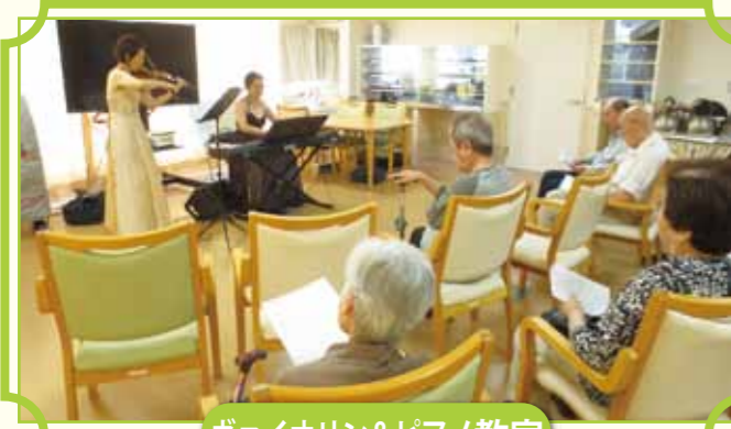
ヴァイオリン&ピアノ教室