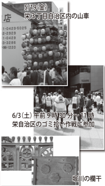
5/19(金) 栄3丁目自治区内の山車

当日は、伏見の電気科学館へ、東西は、堀川・久屋大通り、南北に広小路通り・若宮大通りの学校区で、定期的なゴミ拾いに参加しました。三つ蔵通りは、たばこポイ捨てが多く、折角の花壇にも空き缶も多くあります。百名召集で三つの班に分かれて九〇分一斉に黄色い帽子を被った参加者が、黙々と広い集めました。企業参加では中部電力議員など、初めて何う顔で、子供達、地主様もご参加の様子です。次回には、全員参加すると良いと営業部長は考えております。NHKの「プラタモリ」が、名古屋城・熱田神宮の報道では高視聴率でしたと日経新聞記事がありました。濃尾平野の熱田台地の突き出たところの名古屋城、その西側を沿って堀川が、熱田の湊を運河で結ぶために開削されました。堀川が施工されたのは一六一〇年、その後、堀川には七つの橋を架けられました。「通称 堀川七橋」の完成です。五条橋・中橋・伝馬橋・納屋橋・日置橋・古渡橋・頭尾橋の七つです。我が街に近い、納屋橋を築いたのは堀川を開削した福島正則で、納屋橋の中央欄干には、「中貫十文字」や、郷土の三栄傑、織田信長、豊臣秀吉、徳川家康の紋が鑄込まれて、名古屋発展のいしずえを築いた先人たちへの設計者の思いも感じられます。