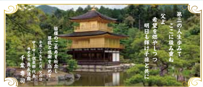
第三の人生歩みへ... 密様のご長寿を祈念し...