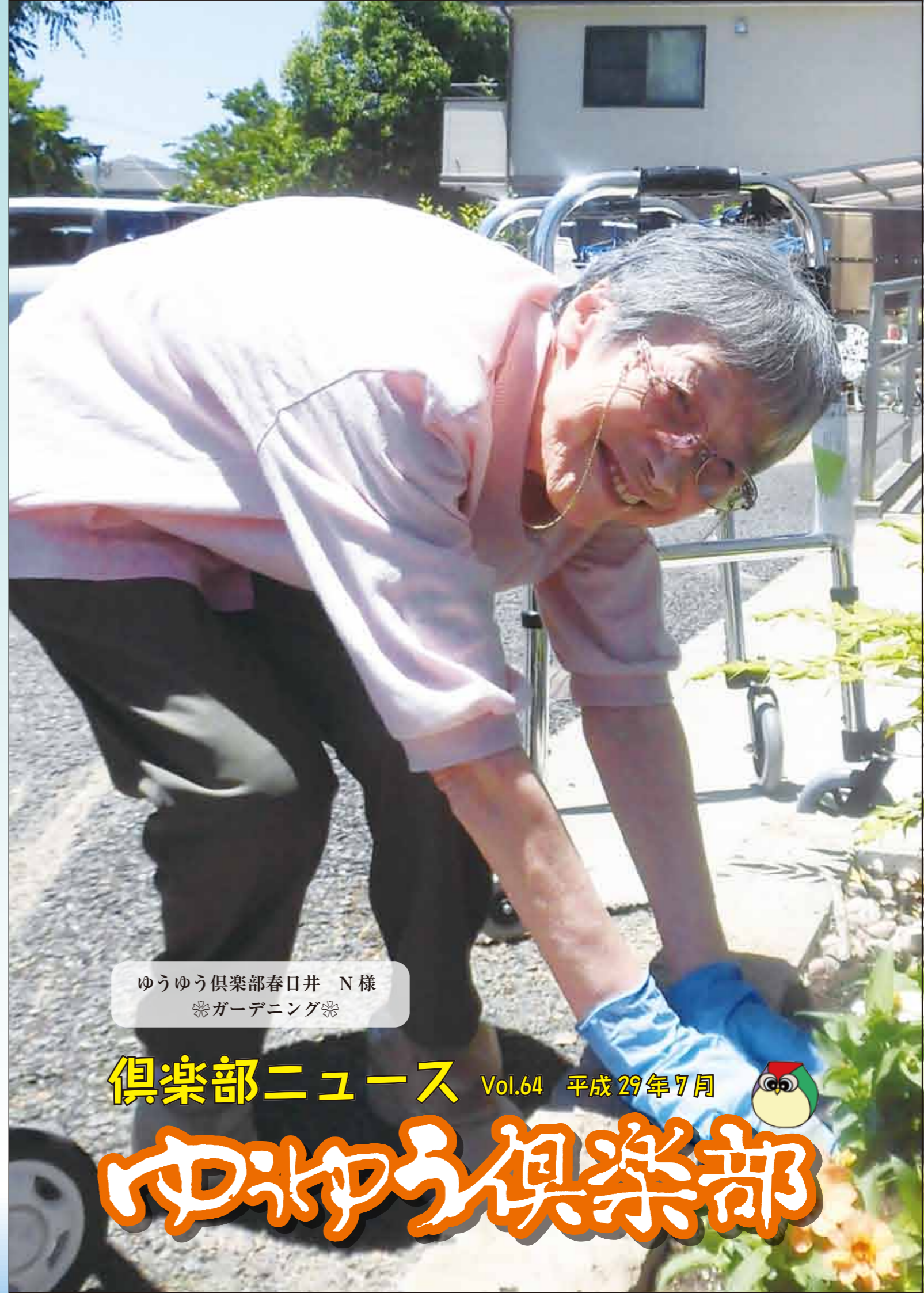
ゆうゆう倶楽部春日井 N様 ※ガーデニング※