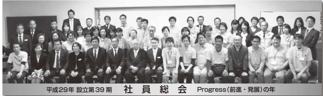
平成29年 設立第39期 社員総会 Progress(前進・発展)の年

まだ知らぬ部分の方が多いたのですが、ただの慣れあいにならず、より良い仕事出来るチームを目指し精進して参ります。