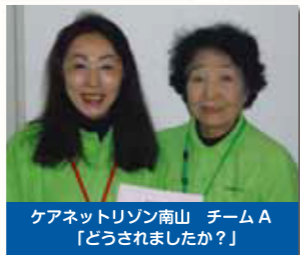
ケアネットリゾン南山 チームA 「どうされましたか?」