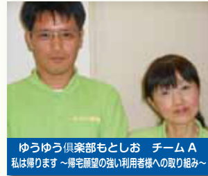
ゆうゆう倶楽部もとしお チームA 私は帰ります～帰宅願望の強い利用者様への取り組み～