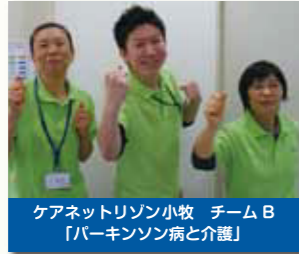
ケアネットリゾン小牧 チームB 「パーキンソン病と介護」