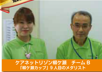
ケアネットリゾン柳ヶ瀬 チームB 「柳ヶ瀬カップ」9人目のメダリスト