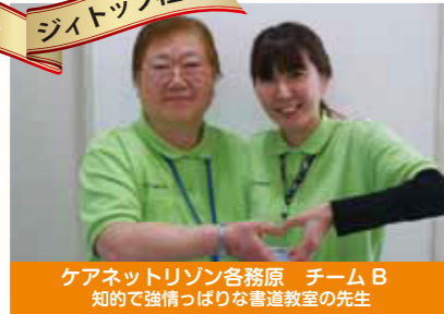
ケアネットリゾン各務原 チームB 知的で強情っぴりな書道教室の先生