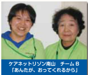
ケアネットリゾン南山 チームB 「あなたが、おってくれるから」