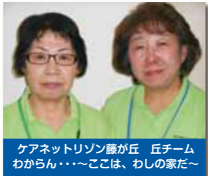
ケアネットリゾン藤が丘 丘チーム わからん・・・ここは、わしの家だ～