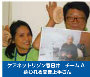
ケアネットリゾン春日井 チームA 慕われる聞き上手さん