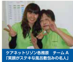
ケアネットリゾン各務原 チームA 「笑顔がステキな風呂敷包みの名人」