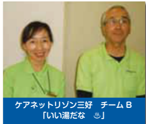
ケアネットリゾン三好 チームB 「いい湯だな ☺」