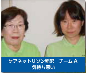
ケアネットリゾン稲沢 チームA 気持ち悪い

アンケートにご協力して頂きましてありがとうございました。皆様から頂いたお声は大切に致します。