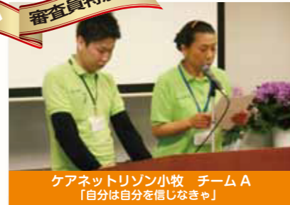
ケアネットリゾン小牧 チームA 「自分は自分を信じなきゃ」