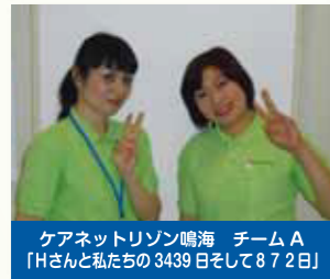
ケアネットリゾン鳴海 チームA 「Hさんと私たちの3439日そして872日」