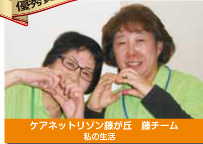
ケアネットリゾン藤が丘 藤チーム 私の生活