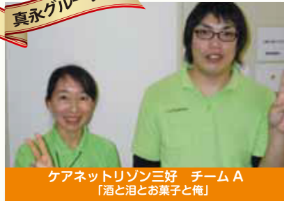
ケアネットリゾン三好 チームA 「酒と泪とお菓子と俺」