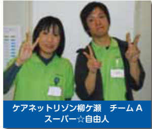
ケアネットリゾン柳ヶ瀬 チームA スーパー☆自由人