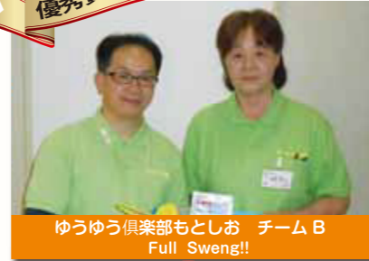
ゆうゆう倶楽部もとしお チームB Full Sweng!!