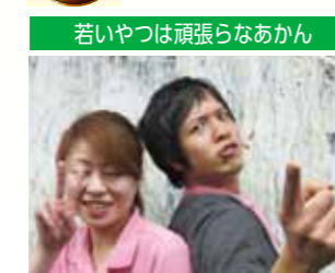
若いやつは頑張らなあかん