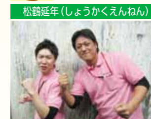
松鶴延年(しょうかくえんねん)