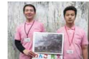
"わんこ先生"との生活