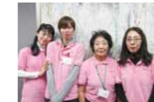
コール! B-16 あっ またTさんだ