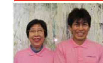
十分な介護をうければ元気になる

アンケートにご協力いただきましてありがとうございました。皆様から頂いたお声は大切に致します。