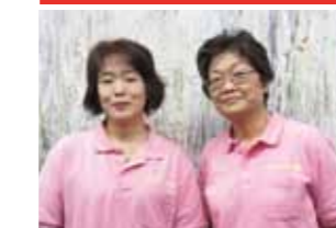
最後まで自分の力で