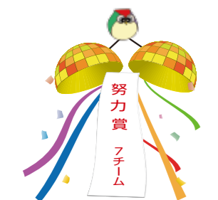
ケアネットリゾン鳴海