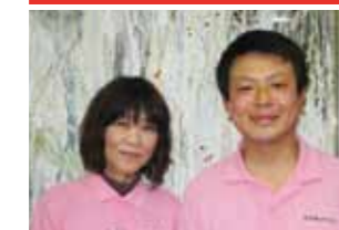
~生命力~ わしも百歳百歳