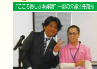
"こころ優しき看護師" ~影の介護主任部長