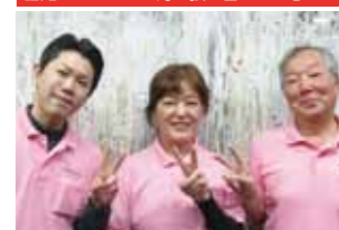
困難をのりこえる力~強き自立への想い~