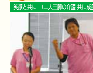
笑顔と共に (二人三脚の介護 共に成長)