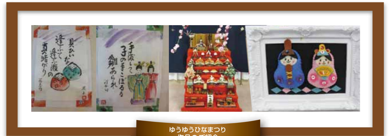
ゆうゆうひなまつり 作品のご紹介