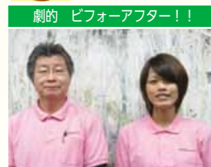
劇的 ピフォーアフター!!