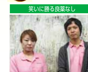
笑いに勝る良薬なし