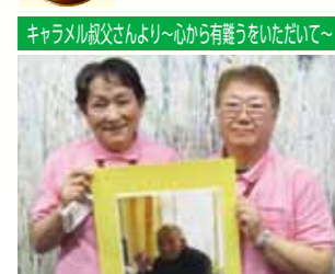
キャラメル叔父さんより~心から有難うをいただいて~