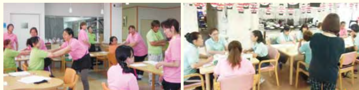
ご協力頂いた講師の先生、ありがとうございました。