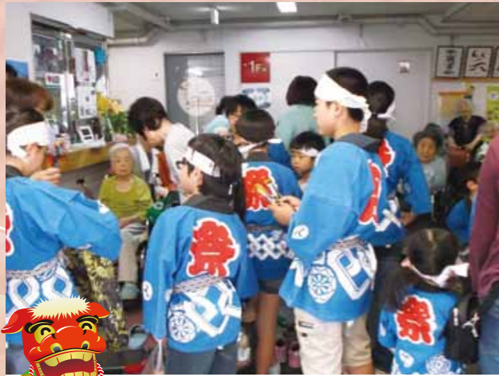
南山 『町内会子供獅子』