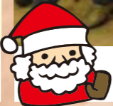
三好 ミュージックレストラン 『クリスマス会』