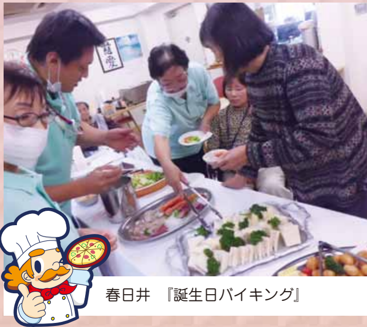
春日井 『誕生日バイキング』