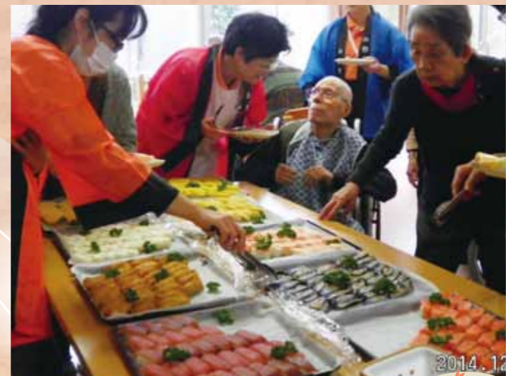
もとしお 『クリスマスバイキング』