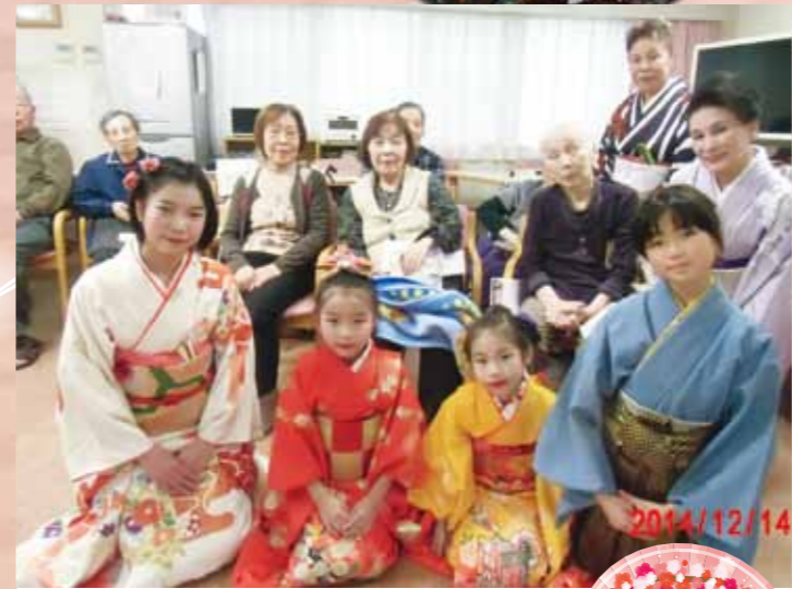
藤が丘 『五条流舞踊』