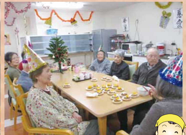
手作りおやつ 『稲沢』