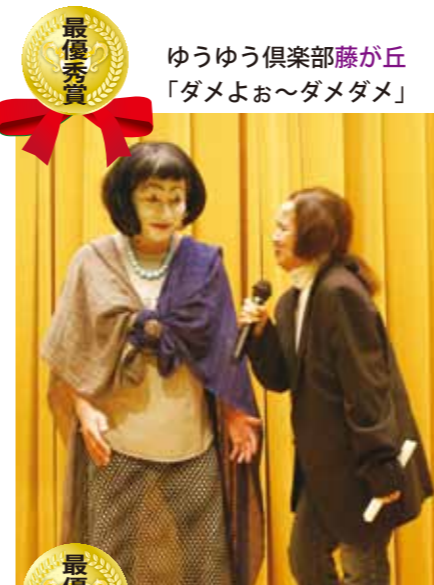
ゆうゆう倶楽部藤が丘 「ダメよお～ダメダメ」