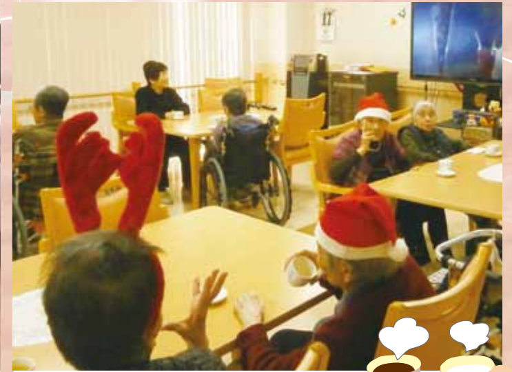
小牧 『Cafe' de 小牧』