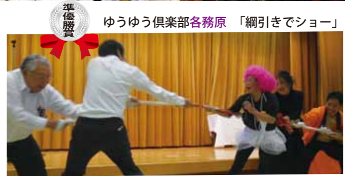
ゆうゆう倶楽部各務原 「綱引きでショー」