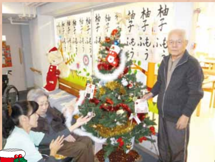
鳴海 『クリスマス飾り付け』