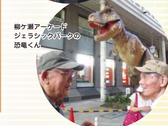
柳ヶ瀬アーケード ジェラシックパークの 恐竜くん