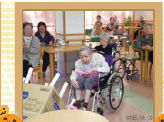
もとしお 輪投げ大会