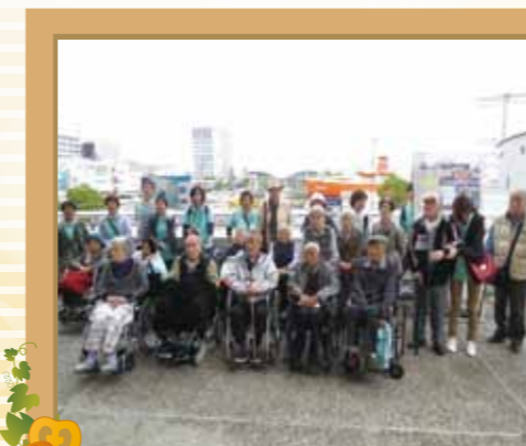
柳ヶ瀬 名古屋港水族館