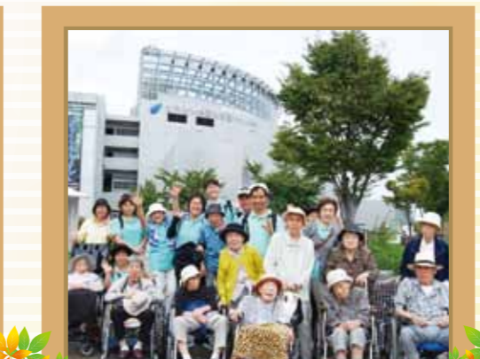
各務原 世界淡水魚水族館 アクア・トド岐早