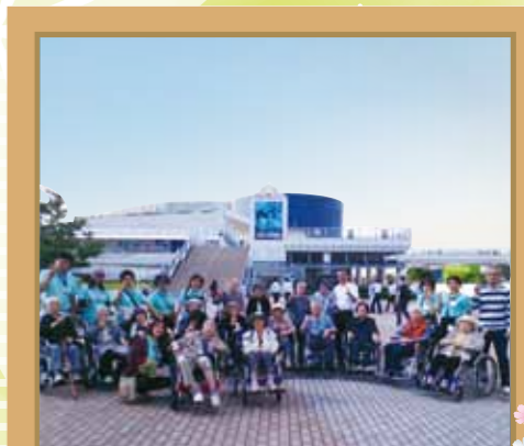
南山 名古屋港水族館