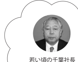
若い頃の千葉社長