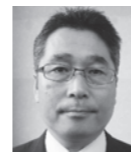
堀江取締役営業部長