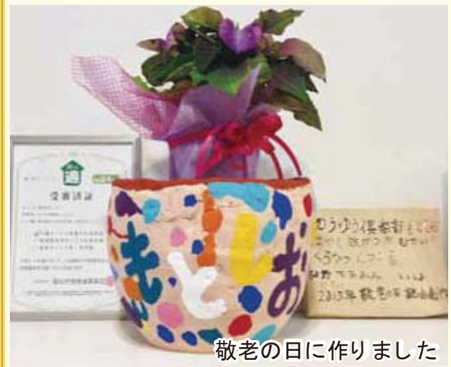
敬老の日に作りました